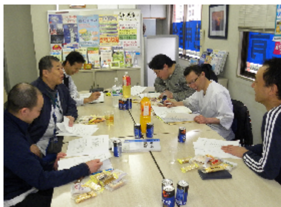
写真は青色会館で行われた青年部総会の模様

女性部・青年部とも平成 23 年度事業報告・決算報告、平成 24 年度事業計画案・収支予算案が滞りなく可決されました。次期も現体制のまま運営されることになりました。