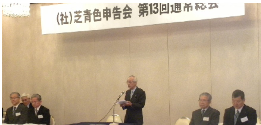
平成23年度第13回総会のスナップ

一般社団法人申請に向けて、委任状 も含め会員総数の4分の3の出席が 必要ですが、4月末現在残念ながら