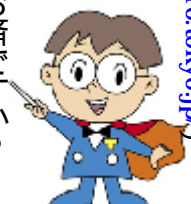
主税局イメージキャラクター タックス・タツヤ

障害者手帳をお持ちの方で、一定の要件に該当する場合は、自動車税・自動車取得税の減免が受けられます。減免を受けるためには、納期限の5月31日(木)まで新たに自動車を取得した場合は登録(取得)の日から1ヶ月以内申請が必須です。減免申請書に必要事項を記入の上、必要書類を添付して、都税事務所、都税支所、支庁、自動車税事務所、都税総合事務センター(0570-064-171)へお問い合わせください。