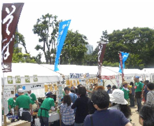
昨年第 6 回芝地区まつりの出店風景

唐揚げ等、さらにパワーアップして参加いたします。ただ、昨年まで共同出店していた戸板短大食物栄養科が、今年はお店が出来なくなつたのが残念です。