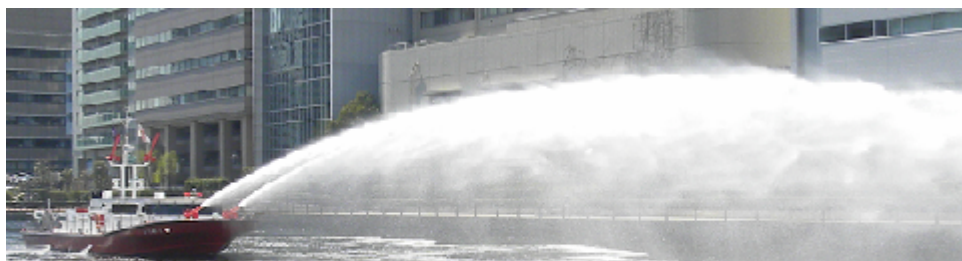
50 メートル以上も海水を吹き上げながら姿を現した最新消防艇「ありあけ」のパフォーマンス放水