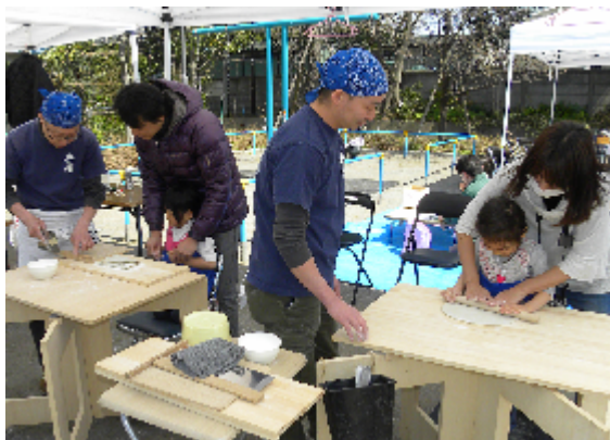
小さなお子様連れの親子が多い地域限定のお祭りでした

当会青年部は昨年の第 2 回目から参加のはずでしたが、東日本大震災発生を受け中止になった経緯があり、